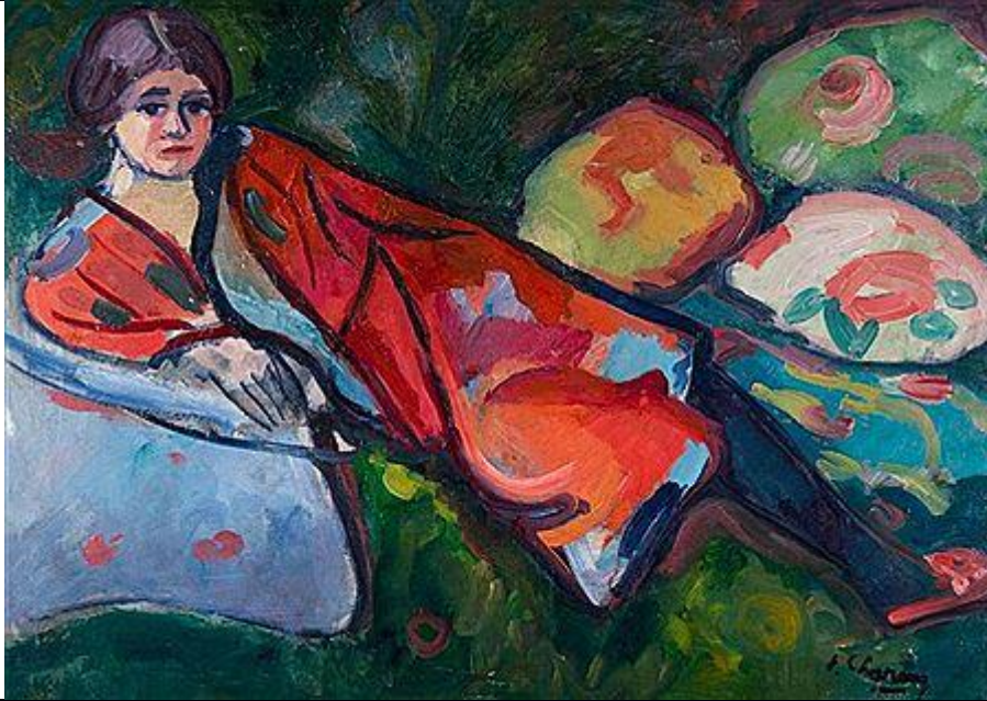
Imatge 1: Dona en bata japonesa . Emile Charny. 1894