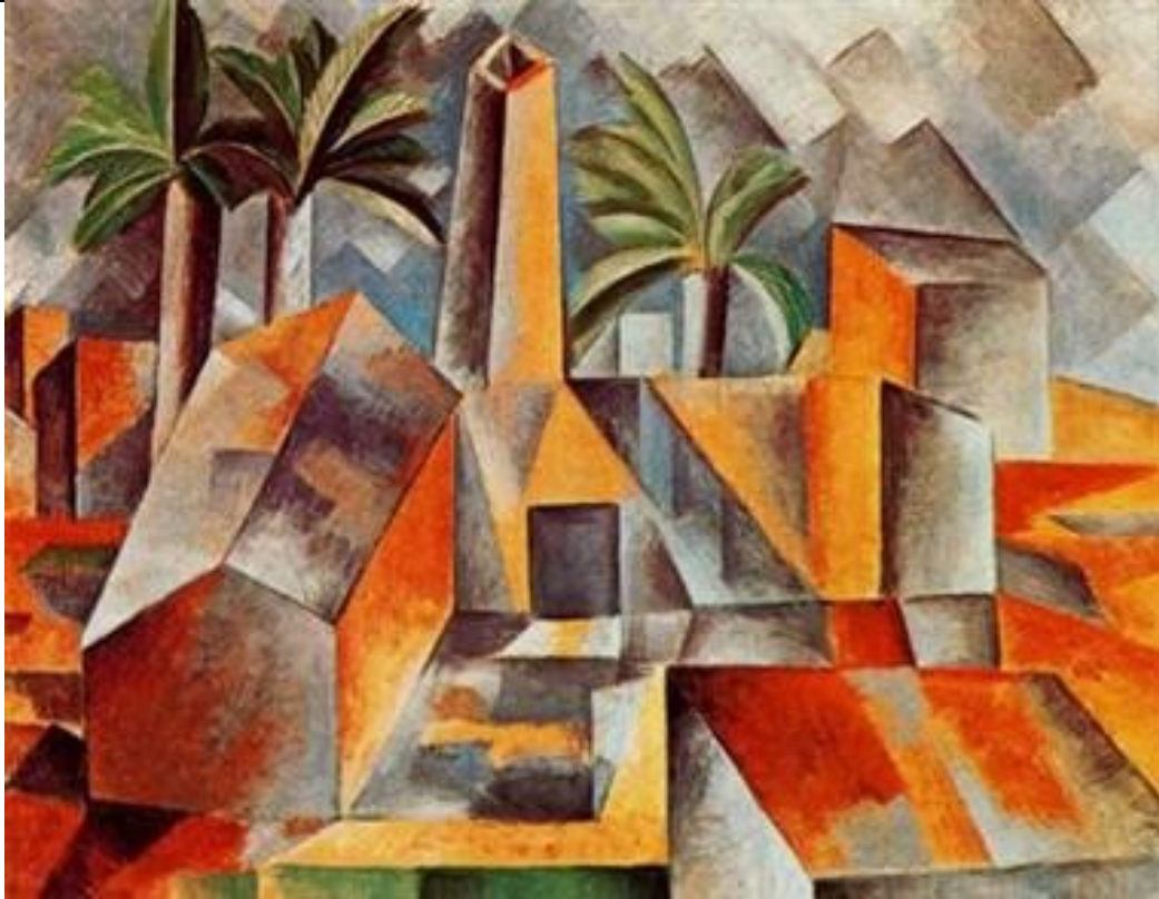
Imagen 1: La fabrica de Horta de Ebro . Picasso. 1909.