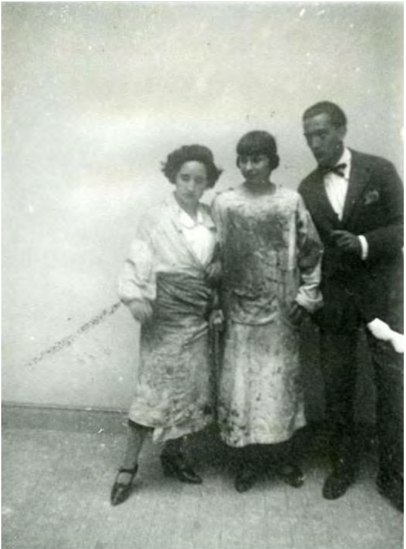
Ernestina de Champourcín junto a Maruja Mallo y Salvador Dalí, los tres estudiantes de Bellas Artes en la Real Academia de San Fernando de Madrid.